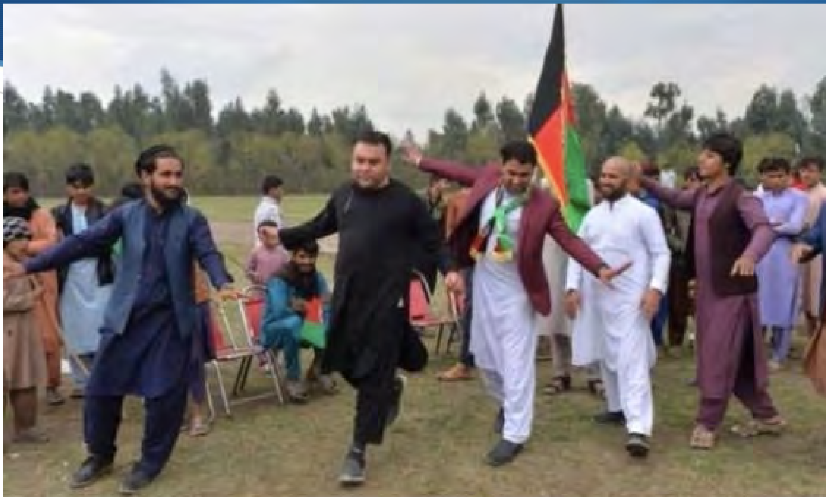
阿富汗人對這一消息感到高興。